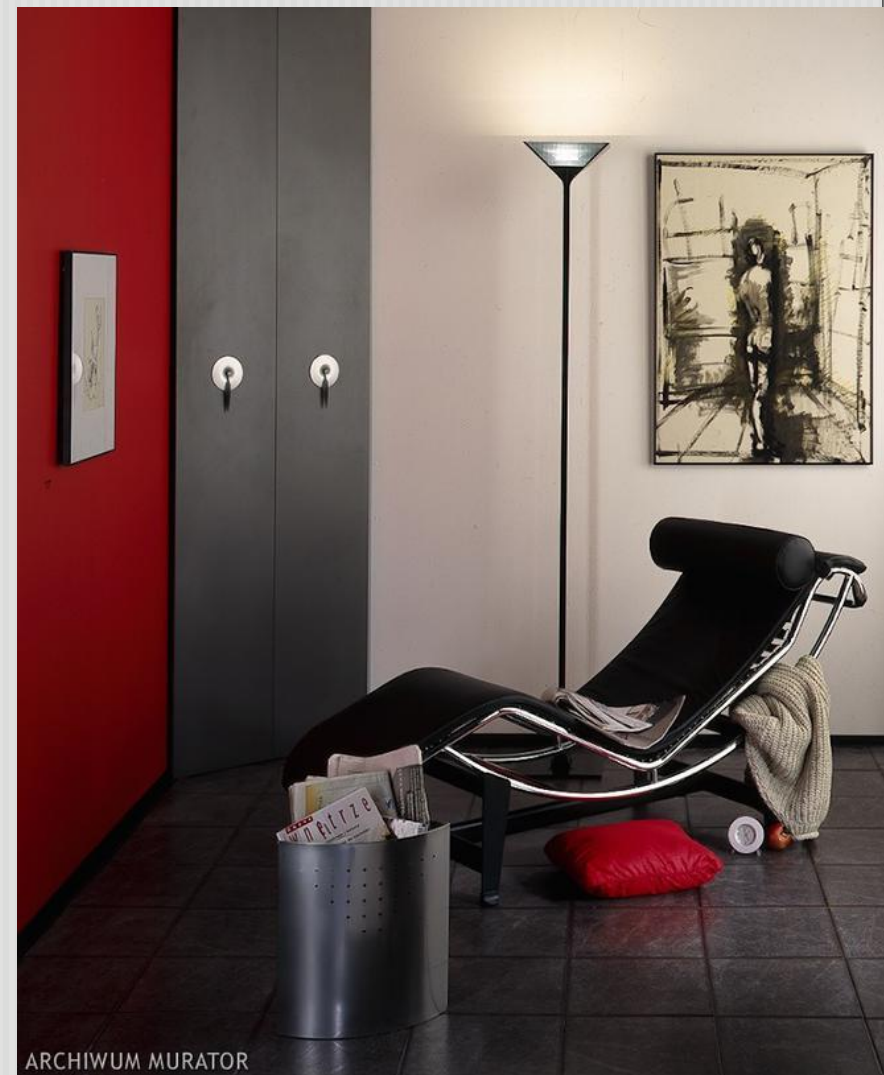
Szezlonek zaprojektowany przez LE CORBUSIERA powstał w 1928