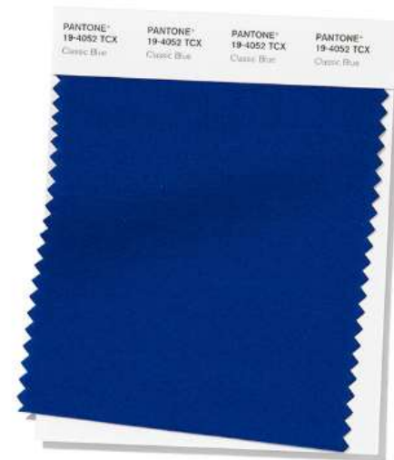
PANTONE 19-4052 Classic Blue

Pungent Saffron adds a flavorful brilliance to the palette.