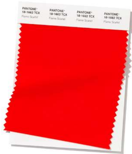
PANTONE 18-1662 Flame Scarlet

Burning bright, Flame Scarlet exudes confidence and