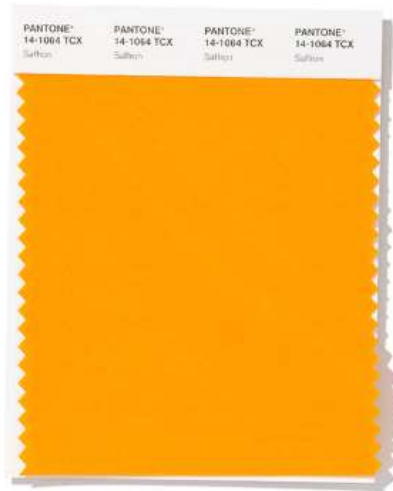
PANTONE 14-1064 Saffron

Burning bright, Flame Scarlet exudes confidence and