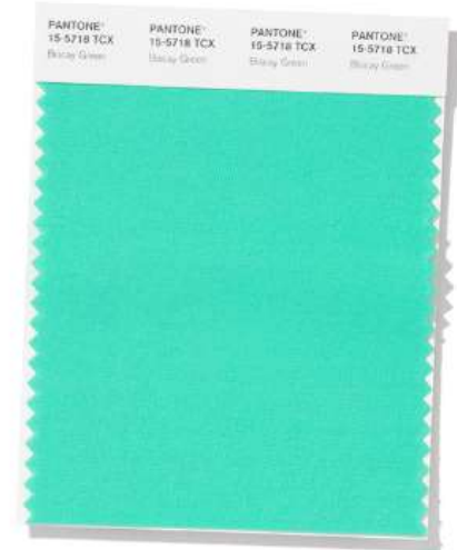
PANTONE 15-5718 Biscay Green

A boundless blue hue, Classic Blue is evocative of the vast and