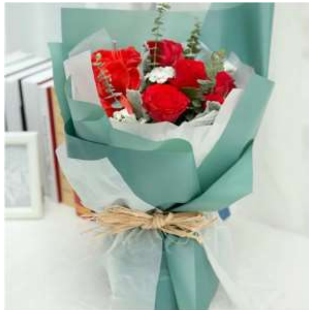
Bukiet w biało-niebieskim papierze