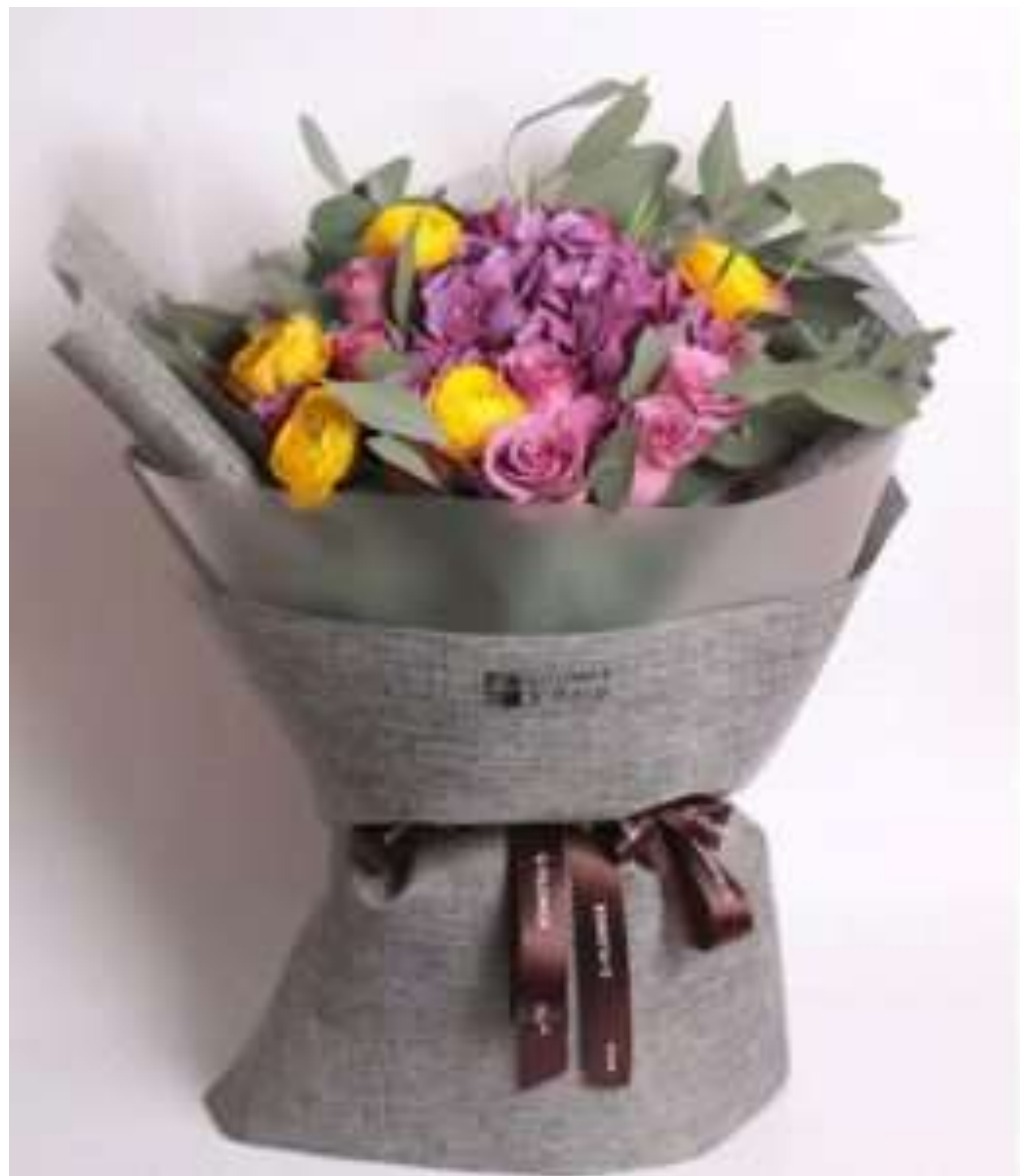
Bukiet w szarym papierze dekoracyjnym